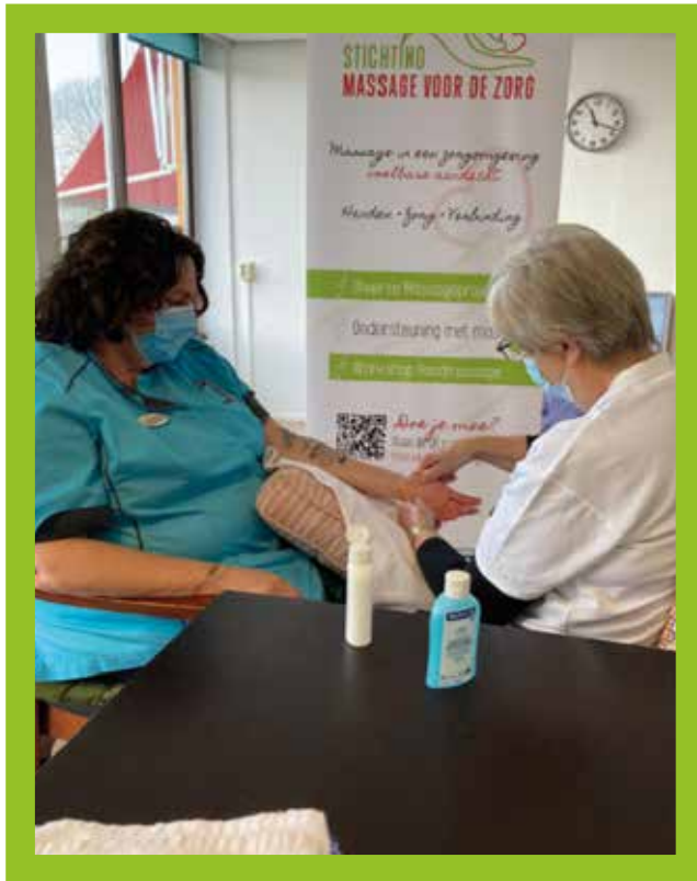
Een van de masseurs van Massage voor de Zorg aan het werk.

Alle hens aan dek, want er moest ineens veel gebeuren!